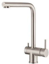
Miscelatore Gamma 3 vie - satinato 8496 100