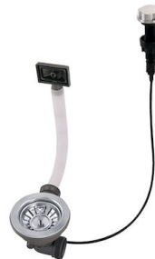
Piletta automatica 8407 000