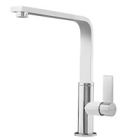
Miscelatore NYC 8486 000