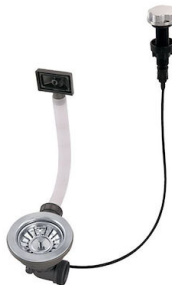
Piletta automatica 8407 100