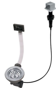
Piletta automatica LIRA 8407 103