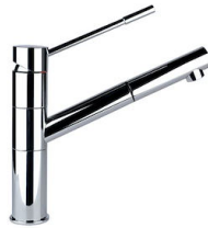
Miscelatore Lorenzo 8466 000